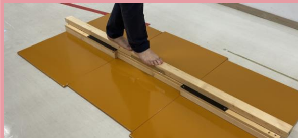
⑦-バランス歩行テスト...バランス年齢を把握するテストです。長さ5mの板上を継脚歩行（8歩）、クリアしたら次の板に移動（だんだん細く）板から落ちた時点で終了！