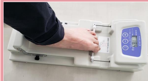
⑨-足把持筋力...足の指の握力測定です。足指の力は若さのバロメーター！足の指の筋力落ちていませんか？