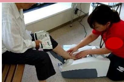
①-骨密度測定...超音波法による測定。骨折を予防する為に密度を計測しましょう！