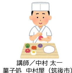
講師／中村 太一 菓子処 中村屋（筑後市）