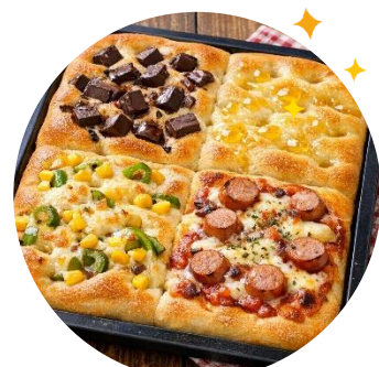
サイズイメージ：約30cm×36cm